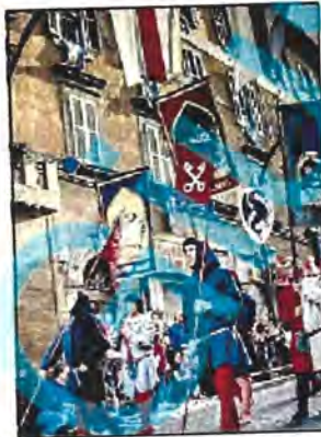
I figuranti della sagra della castagna domani su Raiuno