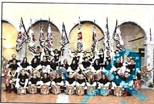
Sbandieratori Sono parte importante della festa che tocca molti tasti, dalle nevocioni storiche alla musica, dalla fiera alla gastronomia

Domani pomeriggio alle ore 15, i cavalieri e gli arcieri di Papacqua, Rocca, San Giorgio e Trinità si sfideranno al campo Giannotti per contendersi il Palio della 50esima edizione della Sagra delle castagne. I cavalieri si affronteranno nella giostra degli anelli. Ognuno di essi avrà a disposizione tre giri di percorso per catturare il maggior numero di anelli. Lungo il percorso ci saranno 9 paletti sui quali vengono affissi 3 anelli di diverso diametro e punteggio. L'anello più piccolo vale 9 punti, il medio 6, il grande 3. Dalla somma dei punteggi di anelli e tempi dei tre giri verrà stilata la classifica finale della giostra. Al primo andranno 4 punti, al secondo 3, al terzo 2 e all'ultimo 1. La stessa identica classifica verrà fatta per gli arcieri che si sfideranno al tiro con l'arco da tre distanze diverse (20, 27 e 35 metri). Per ogni distanza gli arcieri tireranno 6 frecce. Come per i cavalieri, anche per gli arcieri verrà stilata una classifica finale alla quale verranno dati gli stessi punteggi. Dalla som-