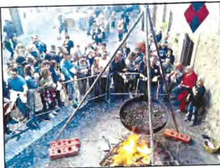
Si avvicina la sagra delle castagne

Domenica, in mattinata, sarà la volta delle giovani leve dei quattro gruppi folcloristici delle contrade; nel pomeriggio la disputa del Palio e in serata "San Giorgio che uccide il Drago" con l'esibizione dei Musici e Focolieri. Giovedì 5 ottobre si esibiranno nuovamente le giovani leve delle quattro contrade, venerdì 6 ci sarà l'esibizione del gruppo storico spadaucini e a seguire lo spettacolo della contrada Papacqua. Sabato 7 la disputa dei giochi popolari e la consueta neocavazione storica "Soriano tra storia e leggenda". Domenica 8 il maestoso corteo storico chiuderà, in maniera non