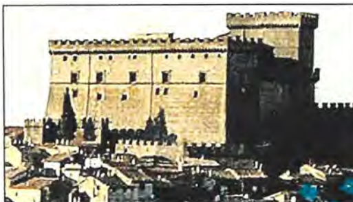
Soriano nel Cimino Due giorni di festa e divertimenti per grandi e piccoli

Il Convivium Secretum è un momento conviviale particolarmente suggestivo, frutto di una meticolosa e accurata ricerca storica-culinaria: il visitatore che deciderà di avventurarsi in questo magico percorso, varcherà la soglia del tempo per immergersi in un'atmosfera di antiche suggestioni e sapori ormai dimenticati. In una scenografia di luci soffuse e di addobbi ricercati, un viaggio culinario spettacolare, dove la scoperta del gusto dell'epoca si avvicenderà agli spettacoli d'arte medievale, con la partecipa-