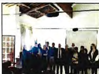
Artista protagonista nella mostra

Una rassegna di dati e notizie sull'artigianato