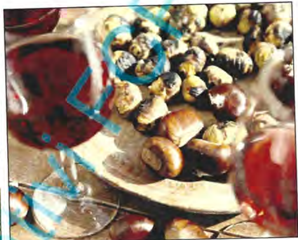
Sagra delle castagne. La manifestazione quest'anno festeggia i 50 anni

per il 29 settembre, e il convegno internazionale del 30 settembre in sala consiliare su castagne, nocciole e tartufo e i loro prodotti post-confezionati nel mondo, una riunione e confronto tra produttori di castagne, nocciole e tartufo e aziende di produzione post-raccolta di Italia, Austria e Stati Uniti. Un evento realizzato in collaborazione con Università della Tuscia e Australian Cultural Centre. Da sottolineare, in apertu-