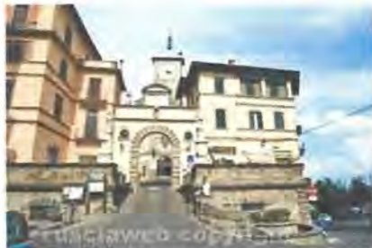
Soriano nel Cimino

Il bando per il drappo, che sarà consegnato alla contrada vincitrice, è aperto a tutti gli artisti italiani e sono aperte le iscrizioni sui siti web www.sagradellecastagne.com e www.prolocosoriano.it , dove è possibile reperire il regolamento e tutte le informazioni necessarie per la partecipazione. Il termine per presentare i lavori è il 25 giugno 2016.