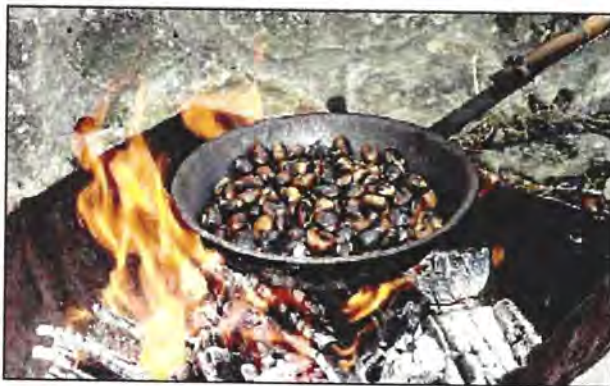
Caldarroste A Soriano nel Cimino