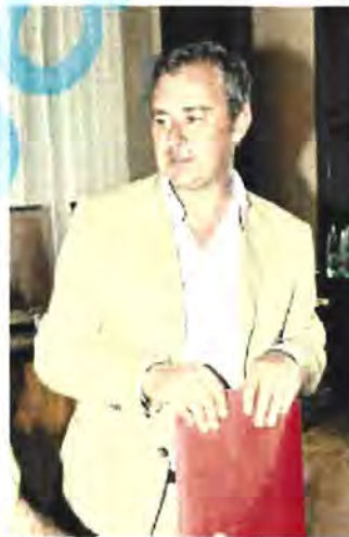
CAMERA DI COMMERCIO Merlani

tornando progressivamente ai livelli di qualche anno fa. In tal senso va fatto un plauso a Comuni e Pro loco per la determinazione nell'aver continuato a organizzare queste iniziative, anche nei periodi in di minor raccolto, continuando a offrire una formidabile vetrina turistica ed enogastronomica del territorio». Conferma