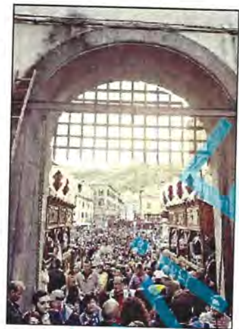
Soriano nel Cimino supera l'ollata Durante il secondo week end di Sagra delle castagne

E da venerdì terzo e ultimo week end di festa