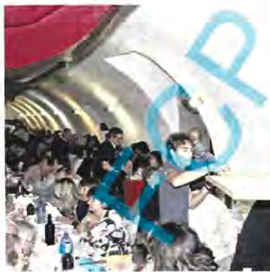
FBLA La cantina di Santa Corona a Canepina: tanti i visitatori