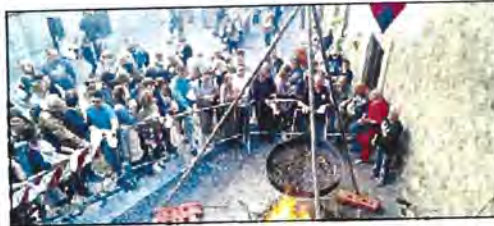
Soriano Distribuzione di caldarroste

Sabato, alle 10.30, in sala consiliare, conferenza internazionale su castagne, noccioline e tartufi e dei loro pro-