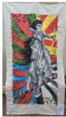
Le quattro opere in gara sono esposte all'ufficio turistico in piazza Vittorio Emanuele II e possono essere visitate dal lunedì al venerdì dalle 10 alle 12, sabato e domenica dalle 10 alle 12.30 e dalle 16 alle 18