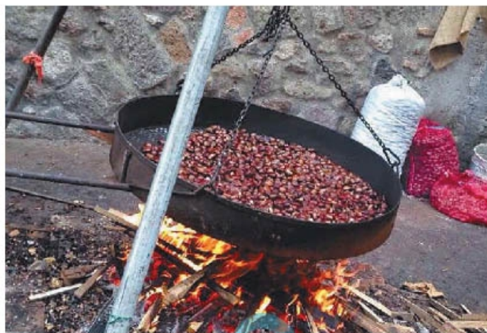
Non mancherà la tradizionale degustazione di caldarroste in piazza

Le origini di questa festa risalgono alla fine del XV secolo, quando fu istituita dal Consiglio della Comunità per commemorare alcuni avvenimenti avvenuti a Soriano nel 1489: il tentativo di conquista del Castello Orsini da parte di Pier Paolo Nardini, signore di Vignanello, e la successiva sanguinosa battaglia del Fosso del Buon Incontro. L'odierna Sagra, la cui durata è stata ufficialmente estesa a tre weekend, va molto oltre l'aspetto gastronomico che a prima vi-