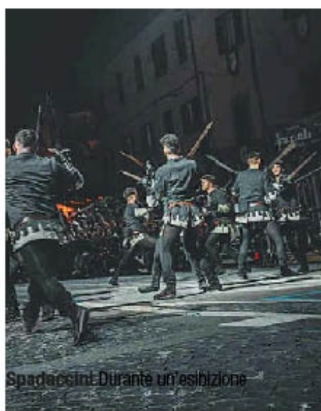
Spadaccini Durante un'esibizione

A seguire lo spettacolo "Fiamma", ovvero l'esibizione del Gruppo musicisti, focolieri e armigeri della contrada San Giorgio, con una coreografia che rievoca le esercitazioni e gli schemi che preparavano i plotoni di soldati alla battaglia, accompagnati da tamburi e