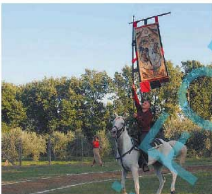
Soriano Anche quest'anno il Palio delle contrade è stato vinto da La Trinità

Il programma degli appuntamenti di questa cinquantesima edizione riprendono