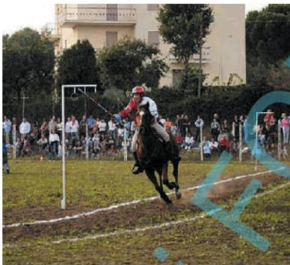
Palio delle contrade. Il drappo sarà assegnato ai vincitori del torneo

Ai partecipanti al concorso viene chiesto di interpretare liberamente un tema che celebra la città di Soriano nel Cimino, con riferimento a storia, tradizione e folclore locali e all'evento specifico del palio. L'iscrizione è gratuita e il bando è rivolto ad artisti italiani e stranieri che abbiano compiuto almeno 16 anni di età. I minorenni dovranno presentare apposita dichiarazione firmata da almeno uno dei genitori o esercenti la patria potestà. Al vincitore sarà conferita la somma di 1000 euro, nelle forme e nei modi previsti dal-