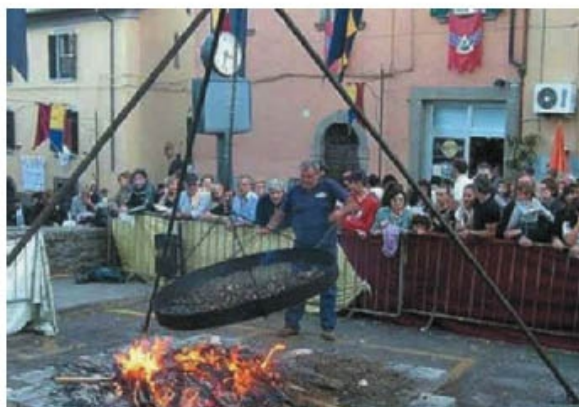
Caldarroste Un'immagine della Sagra delle castagne di Soriano nel Cimino