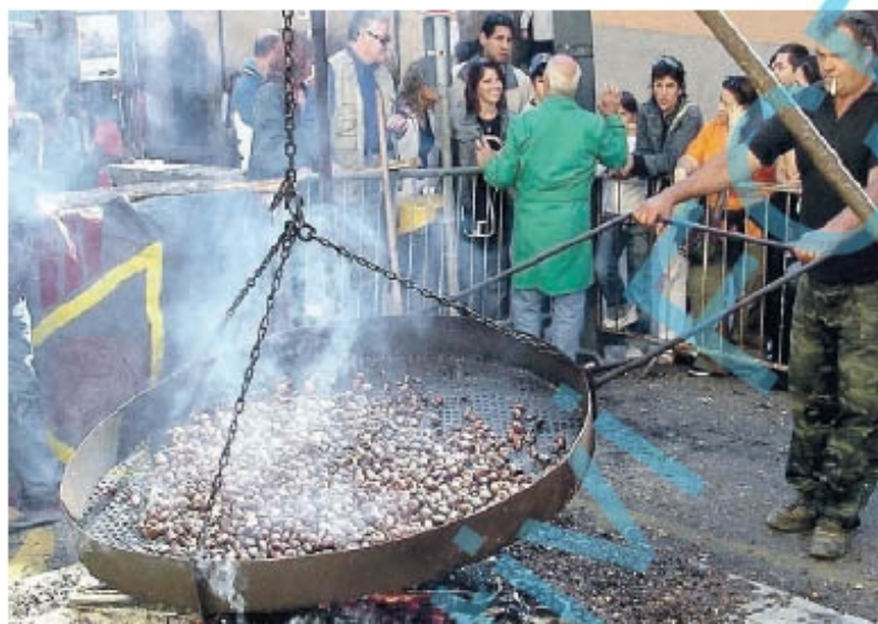
SORIANO NEL CIMINO La sagra delle castagne