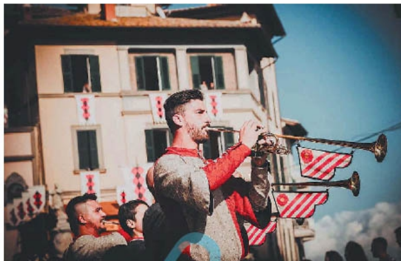
Soriano nel Cimino Prende forma il programma della sagra delle castagne. A inizio autunno l'edizione numero 56 della grande manifestazione

■ L'ente Sagra delle Castagne di Soriano nel Cimino gioca d'anticipo e nella riunione del 12 giugno stila già il programma dell'edizione numero 56 della grande manifestazione storico-rievo-cativa che si svolgerà a inizio autunno. Dopo la scelta del Palio attraverso l'apposito concorso artistico, vinto dall'opera di Sheila Lista, prende forma il cartellone degli appuntamenti organizzati direttamente dall'ente, a cui in seguito si aggiungeranno quelli organizzati da altre associazioni e realtà locali. La principale novità risiede nel fatto che la festa si svilupperà su tre fine settimana e non più su due, dal 29 settembre al 15 ottobre 2023, coinvolgendo come sempre le quattro contrade sorianesi: Papacqua, Rocca, San Giorgio, Trinità. Tuttavia dal 23 settembre sarà già aperta la mostra di abiti e gioielli storici, dal titolo "Vestimenta Historiae", presso il Castello Orsini. Quindi, la Sagra delle Castagne proporrà i suoi eventi tradizionali in costume: la benedizione di arcieri e cavalieri il 29 settembre, il Palio delle Contrade il 1 ottobre, la rievocazione "Soriano tra storia e leggen-