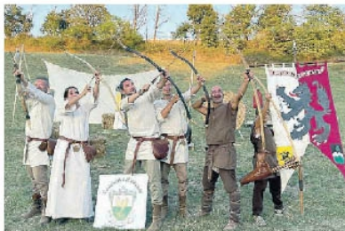
SORIANO NEL CIMINO Gli arcieri protagonisti alla Sagra delle castagne